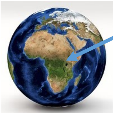
Uganda liegt am Äquator.