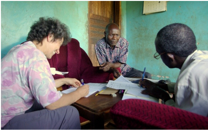
Arbeitsbesprechung in Uganda

Der dörfliche Arbeitskreis sammelt die Zeugnisse ein. Er spricht mit den Familien, wenn die Kinder trotz Unterstützung zur Feldarbeit herangezogen werden, statt wie verabredet in die Schule zu gehen. Es entsteht ein für alle Seiten fruchtbarer Bewusstseinsprozess.