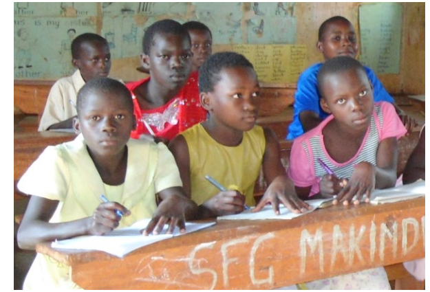
In der staatlichen Dorfschule in Makindu