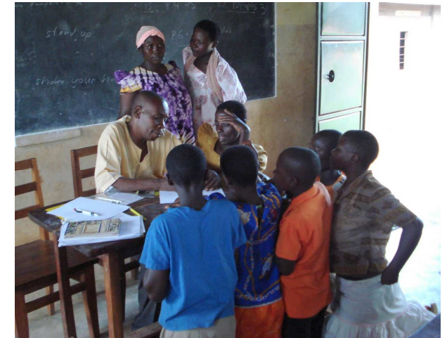
Englisch lernen im Club