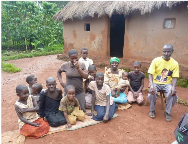
Typische Familie vor ihrem Haus